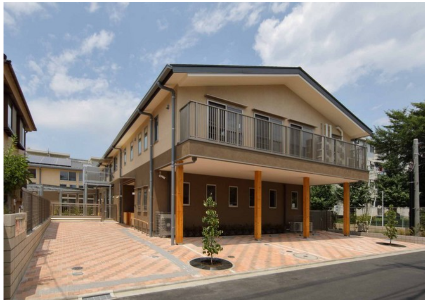
江の島保育園の新園舎